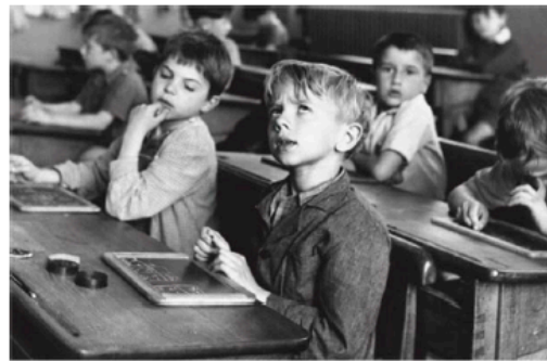
L'information scolaire - Robert Doisneau 1956

Les élèves turbulents ou ne travaillant pas assez devaient porter un bonnet d'âne et aller au coin.