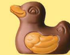
Praliné avec sucre pétillant