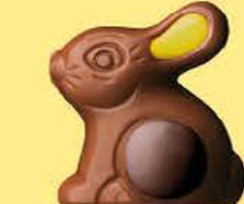
Praliné et riz soufflé