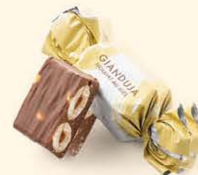
Nougat au miel

POUR VOTRE SANTÉ, PRATIQUEZ UNE ACTIVITÉ PHYSIQUE RÉGULIÈRE. WWW.MANGERBOUGER.FR