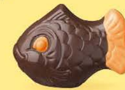
Praliné croustillant aux éclats de crêpe dentelle