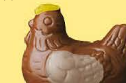
Duo praliné et ganache caramel