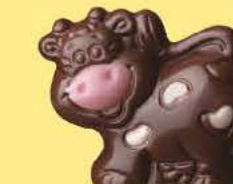
Praliné avec sucre pétillant