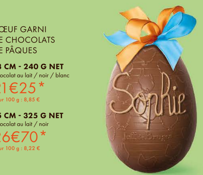
Chocolat au lait

L'œuf au chocolat au lait croustillant aux éclats d'amandes et de crêpe dentelle.