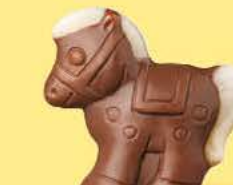
Praliné croustillant aux éclats de crêpe dentelle