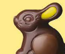
Praliné et éclats d'amandes caramélisées

Un lapin ou une poule, un canard ou un poisson, tout est permis quand on laisse libre cours à la gourmandise !