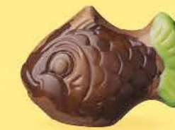
Praliné et noix de coco caramélisée