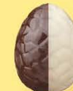
Praliné avec éclats de noisettes