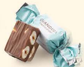
Chocolat au lait