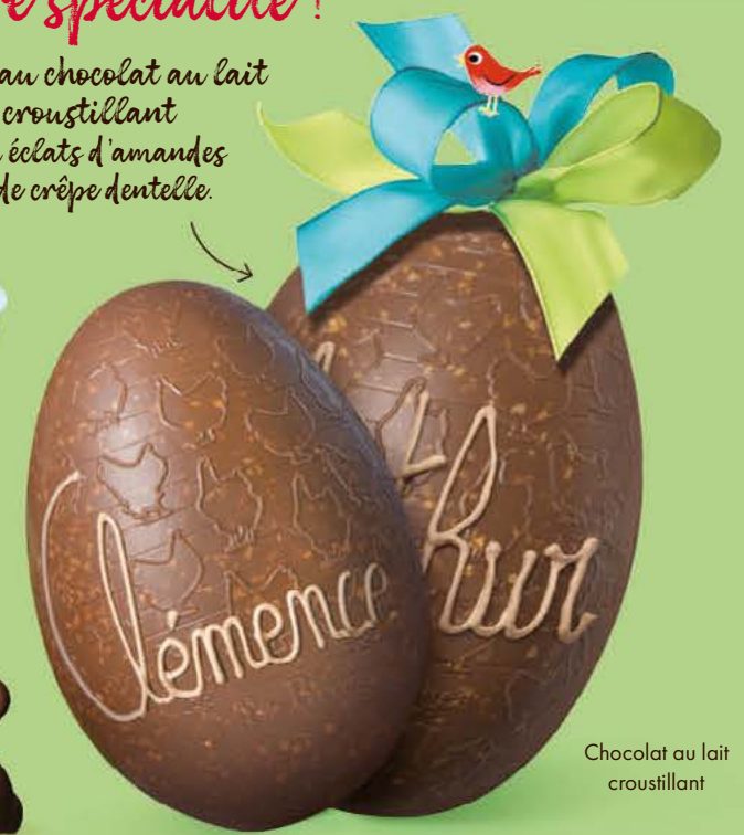
Chocolat au lait croustillant