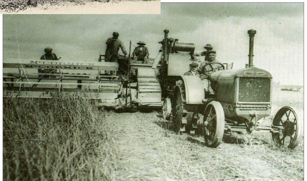
Photographie des moissons aux États-Unis, première moitié du XX e s