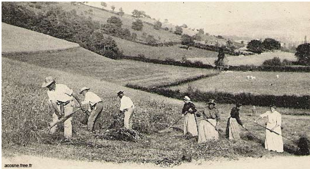
Photographie des moissons dans la région de Nevers, à l'est de Bourges, vers 1905.