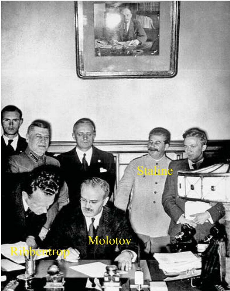
Signature du pacte germano-soviétique

Un protocole secret répartit leur zone d'influence en Europe de l'Est.