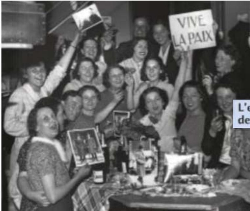
L'enthousiasme des Français pour les accords de Munich (1938).

La Tchécoslovaquie est sacrifiée « pour sauver la paix », Sudètes données à l'Allemagne.