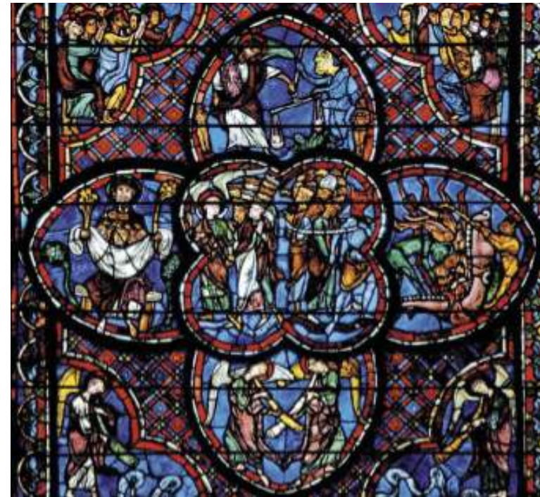
Intérieur de la cathédrale de Bourges