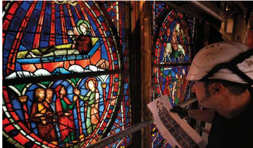
Paris Match Restauration des vitraux de la Sainte Chapelle à Paris Miracle à la Sainte-Chapelle