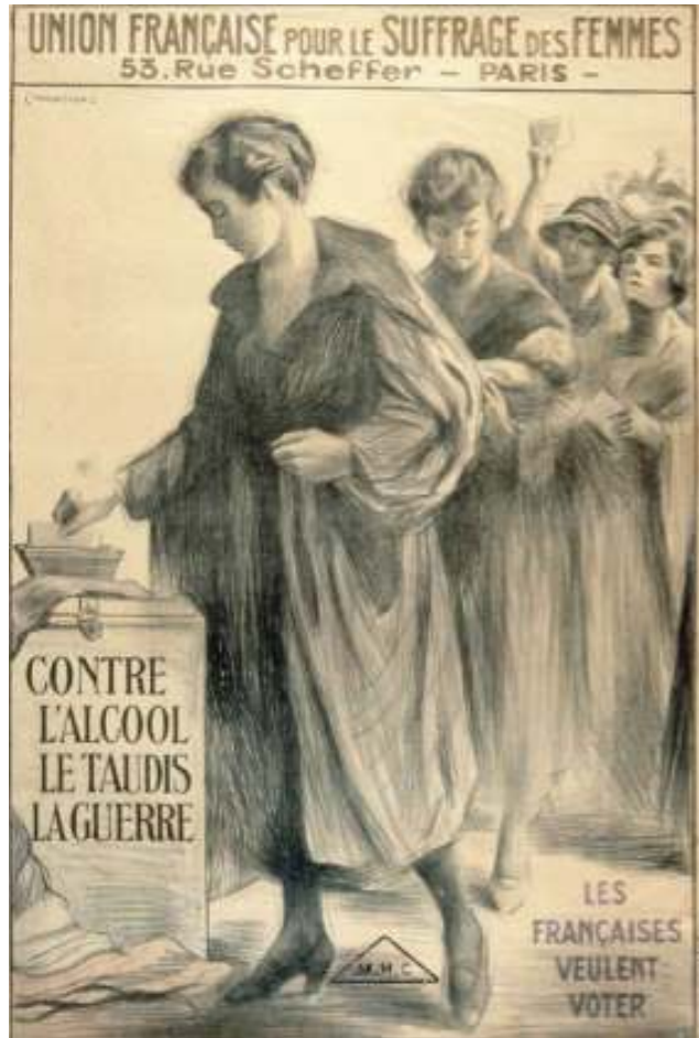
"Les françaises veulent voter"

Alors que la France avait été l'un des premiers pays à instaurer le suffrage universel masculin, il faudra un long processus pour que ce droit soit enfin étendu aux femmes.