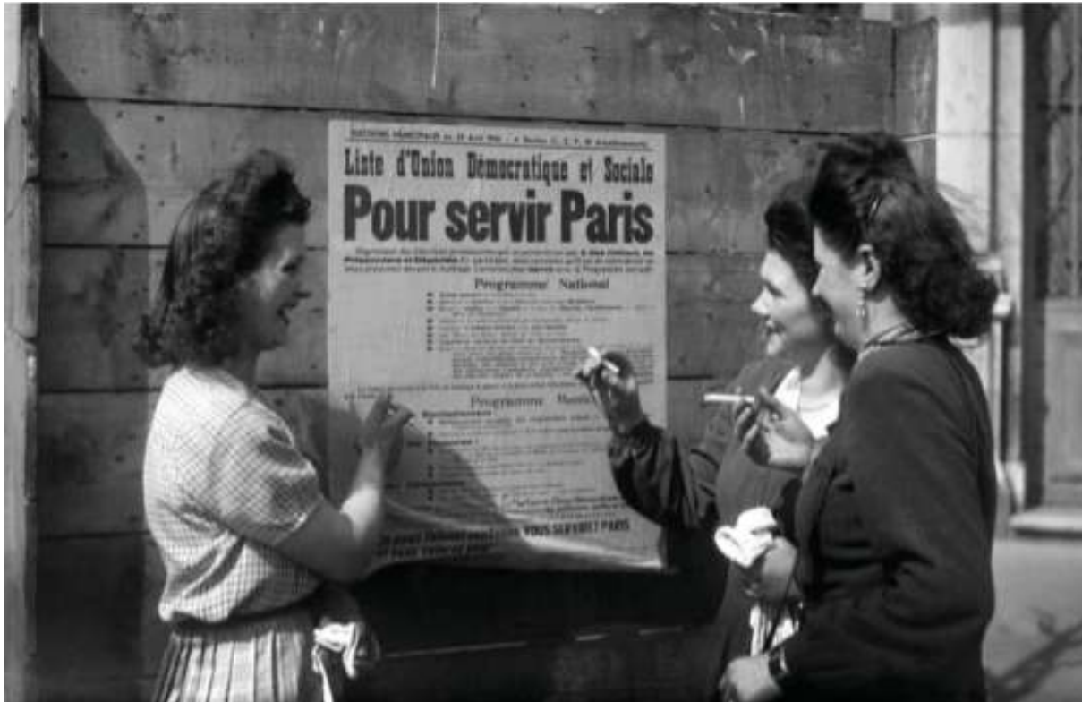
Cigarette au bec, ces Françaises sont devenues des électrices, ce jour du 29 avril 1945 à Paris.

Les Françaises votent pour la première fois le 29 avril 1945, à l'occasion des élections municipales puis, quelques mois après, le 21 octobre 1945 elles participent au scrutin national.