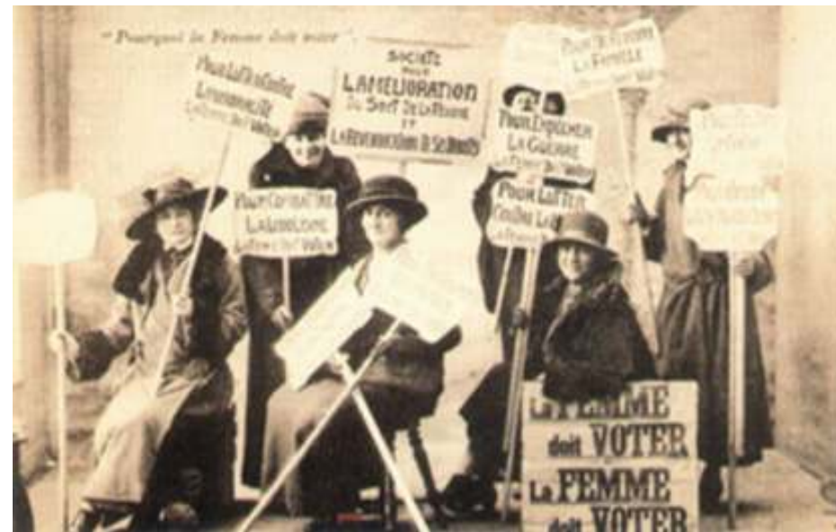
groupe de suffragettes revendication de la Ligue des droits des femmes 1914