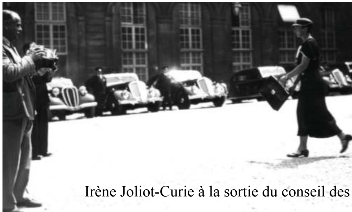
Irène Joliot-Curie à la sortie du conseil des ministres.

En juin 1936 lors du Front Populaire, Léon Blum nomme tout de même trois femmes sous-secrétaires d'Etat : Suzanne Lacore à la Santé publique, Cécile Brunschvicg à l'Education nationale et Irène Joliot-Curie à la Recherche scientifique.