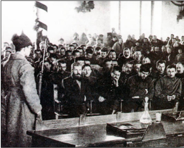
Les grands procès de Moscou de 1936/37 à 1938