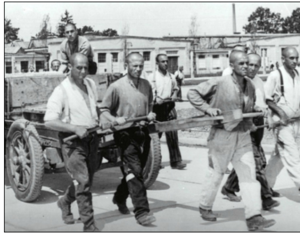
Des opposants politiques dans le camp de concentration de Dachau, 1938

Quel aspect des régimes totalitaires se dégage de ces deux photographies ? 2 pts