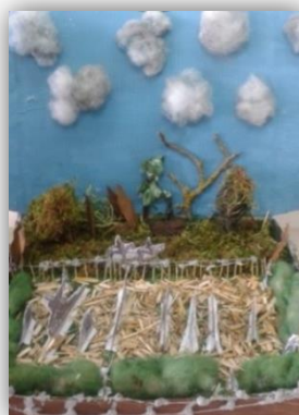
Diorama ou maquette de reconstitution historique du champ de bataille.

Présentation du travail et animations le 10 novembre à partir de 15h : correspondances imaginées par les élèves, visite du vieux pays, expositions, jeux traditionnels, chants, spectacle son et lumière théâtralisé autour d'événements de la guerre à Goussainville (le pillage, le rationnement. le cantonnement...).