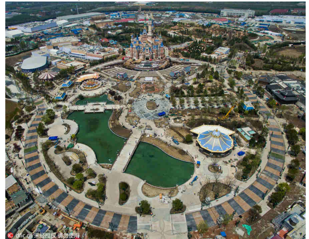
Disneyland Shanghai a ouvert en 2016 et se situe à l'est de la ville dans le district de Pudong à proximité de l'aéroport international

2. D'après les documents 1 à 5, quels sont les différents types de nouvelles centralités métropolitaines ? Décrivez leurs fonctionnalités et citez des exemples. Faites un tableau pour répondre à la question