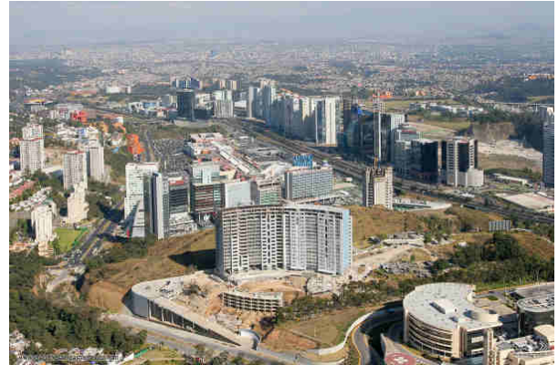
Le nouveau quartier des affaires de Mexico a été construit à Santa Fé à 15km du centre de Mexico

Les documents 1 à 5 sont extraits de Métropoles et mondialisation, la Documentation photographique , 2011. Localisation au préalable des différents exemples (1 à 5) avec Google Earth