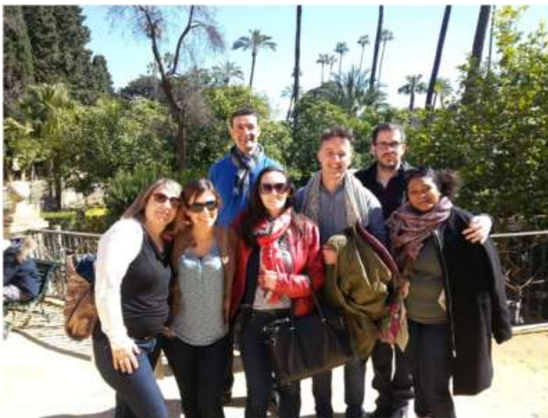
Photo prise pendant la visite guidée