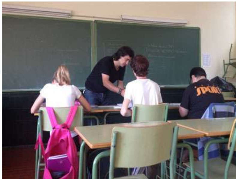
En cours de comptabilité

Comme l'établissement IES HELIOPOLIS ne propose pas de filière commerciale, le Chef de Travaux m'a mis en relation avec un lycée professionnel qui propose les filières commerciales afin que je puisse réaliser mon projet de partenariat. Cette rencontre a été fructueuse. Ce lycée semble très intéressé par ce projet et nous devrions commencer à travailler ensemble en septembre prochain.