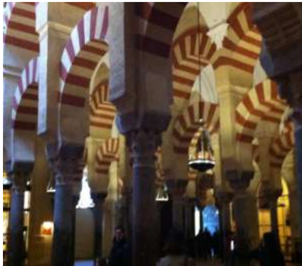
La Mezquita de Cordoue

Nous avons visité l'Alcazar de Cordoue, la Mezquita et le jardin des 13 patios en un seul jour. Nous voulions faire le musée qui retrace l'histoire de la cohabitation du peuple chrétien, juif et musulman mais nous n'avons pas eu le temps. Le train de retour n'allait pas nous attendre tout de même !!!