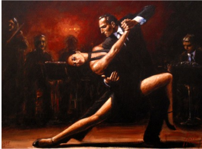
Tango IV, Fabian Perez

El tango, este baile muy expresivo e intenso, nació en los barrios populares de Argentina en los años 1880. Primero bailado por personas de clase social obrera, él se difundió hasta París y empezó a ser un fenómeno de moda. Así su fama cambió y fue bailado por personas de buenas familias. El tango no solo es una historia de baile sino también de música y eso da mucho más importancia a este arte. Por eso varias personas fueron inspiradas por él, entre las cuales Carlos Saura.