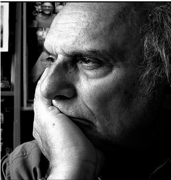
Carlos Saura, realizador español.

El tango, este baile muy expresivo e intenso, nació en los barrios populares de Argentina en los años 1880. Primero bailado por personas de clase social obrera, él se difundió hasta París y empezó a ser un fenómeno de moda. Así su fama cambió y fue bailado por personas de buenas familias. El tango no solo es una historia de baile sino también de música y eso da mucho más importancia a este arte. Por eso varias personas fueron inspiradas por él, entre las cuales Carlos Saura.