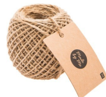
Ficelle jute nature 2mm 50m

Toutes les fiches créatives sur Zodio.fr