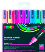
Set 8 posca pointe moyenne pastel