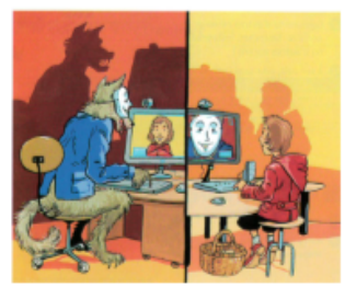
Illustration d'Emmanuel Cerisier Sur Internet, on ne voit pas les personnes avec lesquelles on dialogue. Si on les connaît « en vrai », on n'est jamais sûr que ce sont bien elles. Si on ne les connaît pas, et même si elles ont l'air gentilles, elles peuvent avoir de mauvaises intentions.