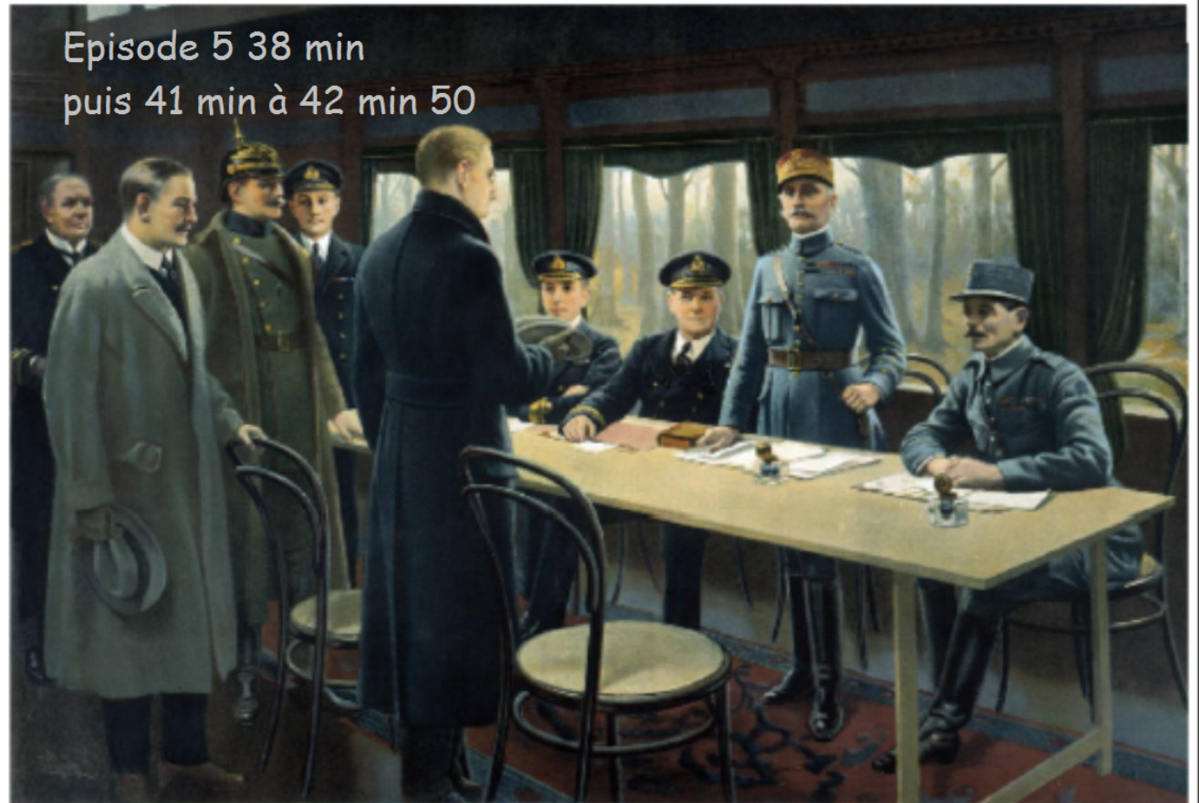
La signature de l'armistice à Compiègne