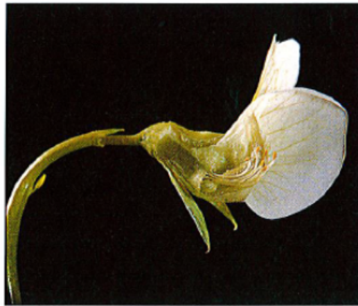
1 er avril : la fleur du pois. Taille : 1 cm

Votre travail d'aujourd'hui est de dessiner la fleur de la page suivante.