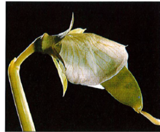
15 avril. Taille : 2 cm