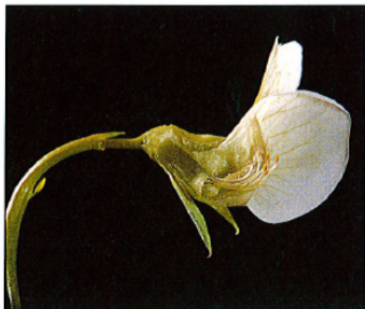
1 er avril : la fleur du pois. Taille : 1 cm