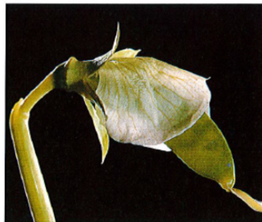
15 avril. Taille : 2 cm