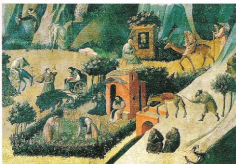
Travail des moines. Détail de la Thébaine de Fra-Angelico (1400-1455)

Source : Histoire-géographie CMI (hachette Education)