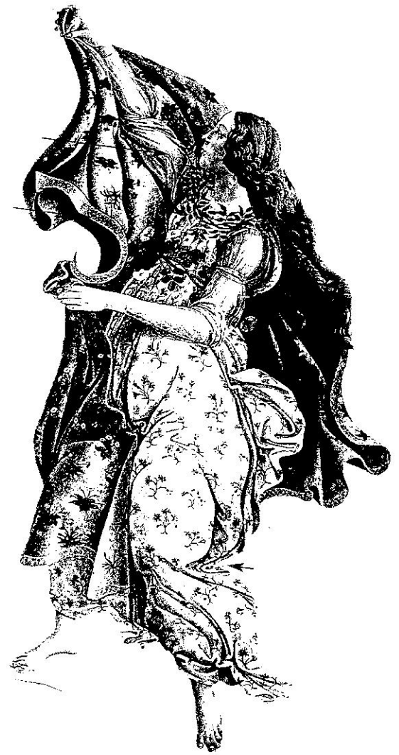
une peinture qui représente le printemps