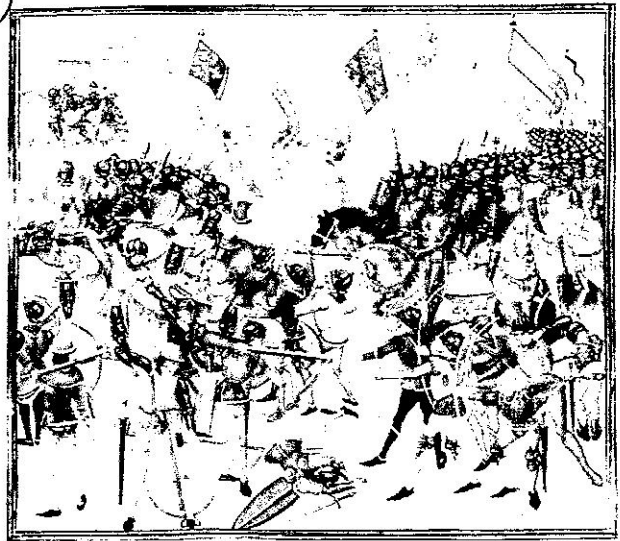
La Bataille de Crécy, 1346 (enluminure du XV ème siècle)