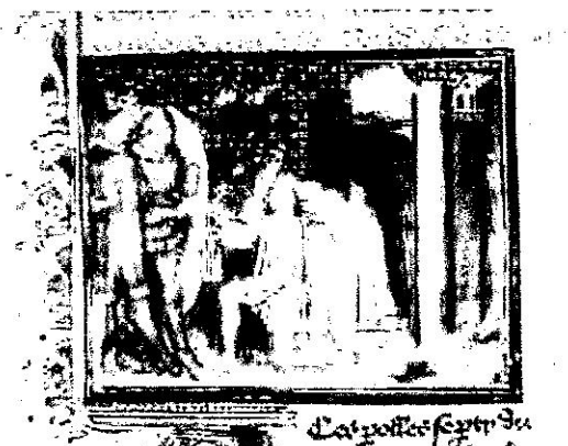
Les bourgeois de Calais, 1347 (Chronique de saint Alban du XV ème siècle)

ensemble de lois apportées par les Francs, l'une d'elles interdit aux femmes d'hériter d'une terre. chef des armées françaises.