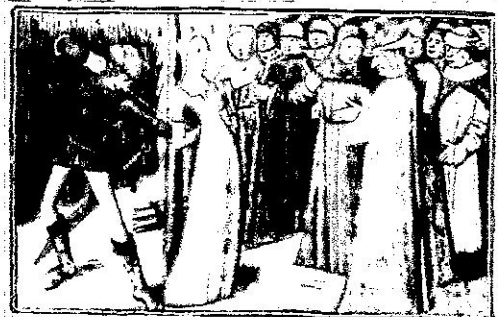
Jeanne d'Arc au bûcher (miniature de 1484)