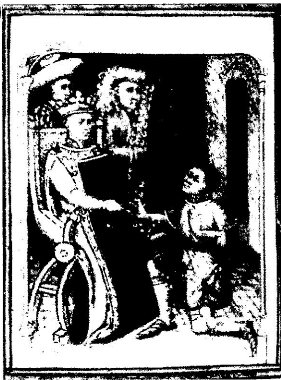
Le roi Charles V fait Du Guesclin connétable, miniature du XV ème siècle.

Du Guesclin est un officier du roi. C'est un chef de guerre habile. En 1370, le roi de France le nomme connétable c'est-à-dire chef des armées française.