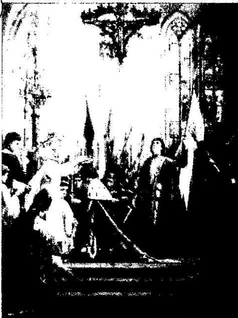
Jeanne d'Arc au sacre de Charles VII, à Reims, le 17 juillet 1429. Tableau de Jules Lenepveu, 1890.