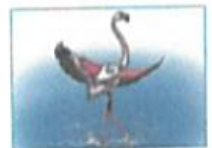
le flamant rose

Ma tête est noire. J'ai le ventre blanc. Mes pattes et mon bec sont rouges. Qui suis-je ? Je suis la sterne arctique.