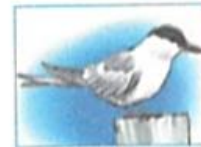
la sterne arctique