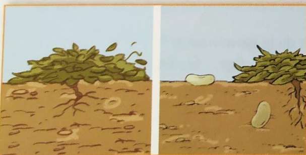
DOC. 4 Un plant de haricot après la fructification