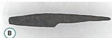
(B) Couteau en fer du 5 e siècle