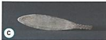
(C) Cuillère en os de 15000 av. J.-C.