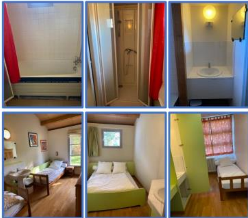
Le Château de Guedelon