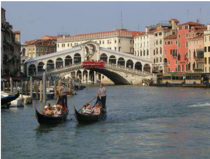
Grand canal et pont du Rialto

Venise est célèbre pour ses canaux bordés de luxueux palais (dont le palais des Doges), ainsi que pour la place et la basilique Saint-Marc et son carnaval .