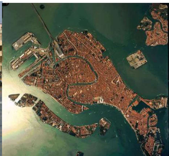
Vue satellite de l'archipel de Venise. Au centre : le Grand Canal.