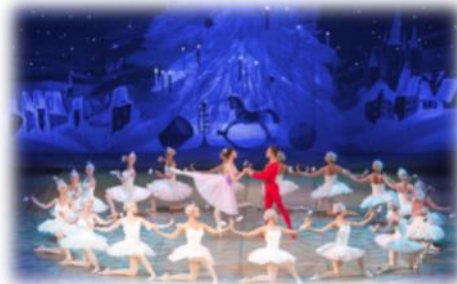
Une représentation du ballet « Casse-Noisette »

Masita aime ce livre car il est très joliment illustré.