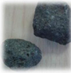
les roches volcaniques