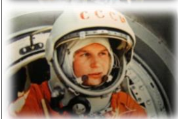
Le système solaire, Laïka, Louri Gagarine

Le premier être vivant à être allé dans l'espace est une chienne nommée Laika . Malheureusement, elle est morte dans l'espace. Le premier être humain dans l'espace s'appelle Louri Gagarine ... comme notre centre de loisirs !