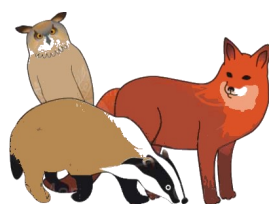
Les prédateurs du hérisson

Le hérisson est un petit animal qui mange des insectes. On dit qu'il est insectivore . Il mange aussi des vers et des escargots. Il sort surtout la nuit. On le reconnaît car il a des poils très longs et très durs qui lui servent de défense contre les prédateurs comme le renard, le blaireau ou le hibou. Lorsqu'il est attaqué, le hérisson se met en boule pour se défendre. Malheureusement, il se met aussi en boule lorsqu'il traverse une route et qu'une voiture arrive sur lui. C'est pourquoi beaucoup de hérissons se font écraser.