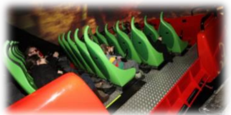
Angel et son souvenir. L'attraction Arthur et les Minimoys