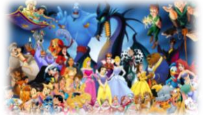
Les personnages Disney