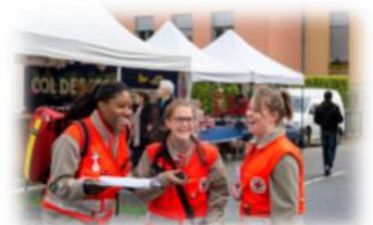
Des bénévoles de la Croix Rouge