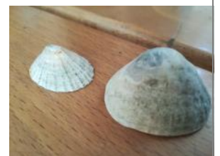
des chapeaux chinois