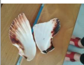
Une coquille Saint-Jacques