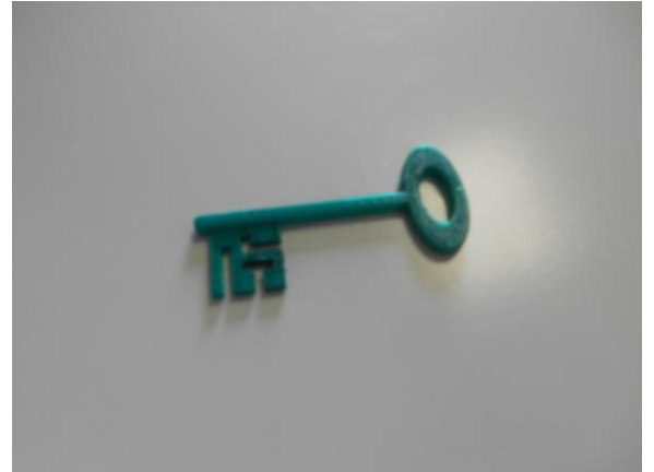
La clé réalisée par l'imprimante