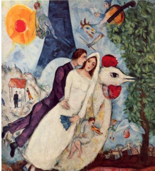
Les Mariés de la tour Eiffel

Et enfin pour la rêverie « dans les nuages », nous avons découvert un artiste : Marc Chagall