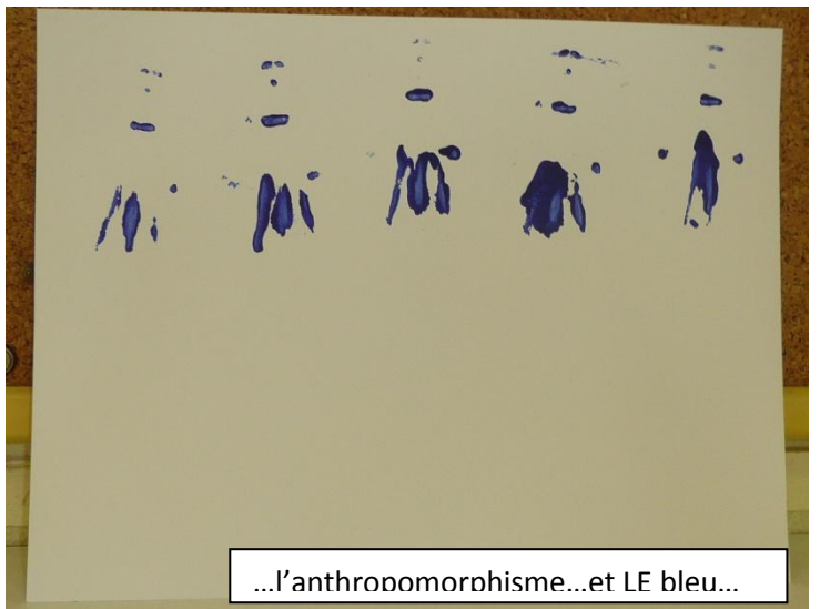
...l'anthropomorphisme...et LE bleu...