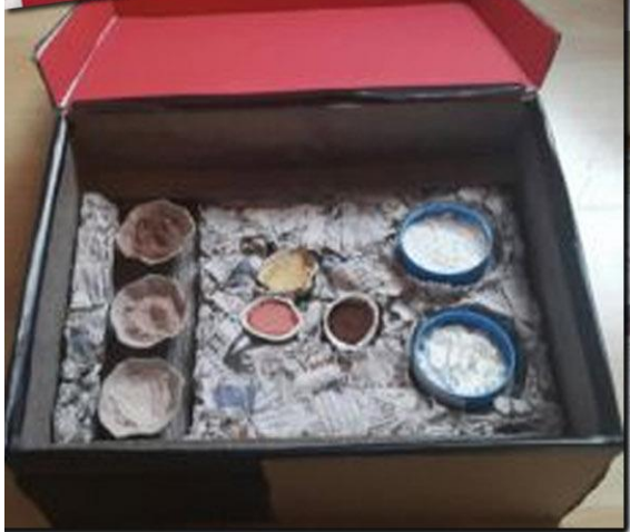
Réalisation d'un coffret à partir de matériaux recyclés