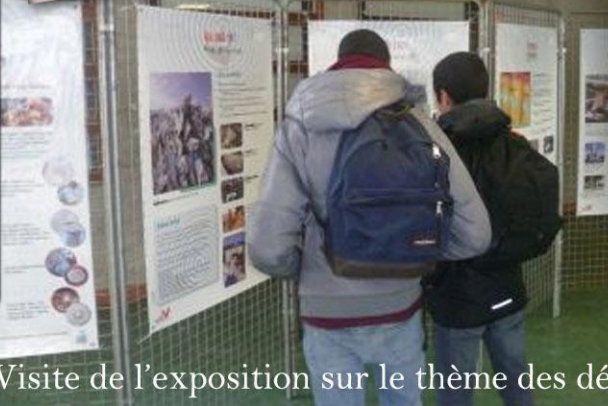
Visite de l'exposition sur le thème des déchets