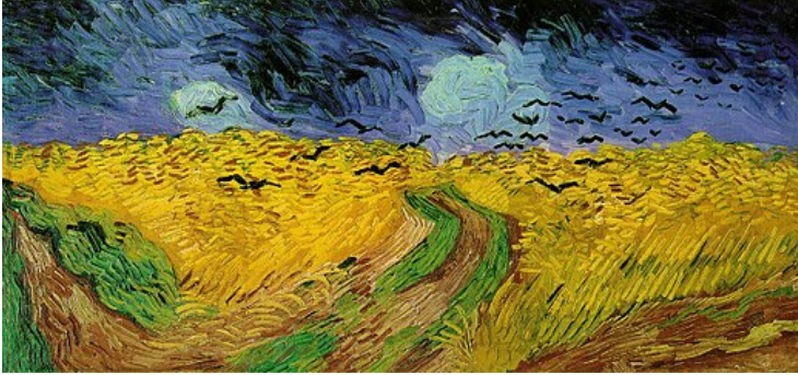
Champ de blé aux corbeaux, 1880 ? Vincent Van Gogh, huile sur toile

Il fait partie des peintres impressionnistes . Les traits de pinceaux sont très visibles, cela donne une impression de mouvement du blé, de l'herbe et du ciel.