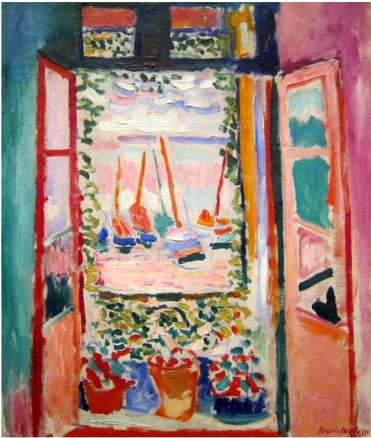
Fenêtre ouverte sur Collioure, National Gallery , Washington

Et pour être complètement dans notre thème pour le projet, Henri Matisse a intégré la fenêtre dans le paysage... ou le paysage dans la fenêtre !