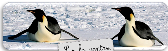
Sur le ventre.