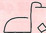
avoir un enfant

Vers 1100 av. J.-C., les Phéniciens ont inventé le premier alphabet. Chaque signe représentait un son. L'alphabet comportait 22 signes.