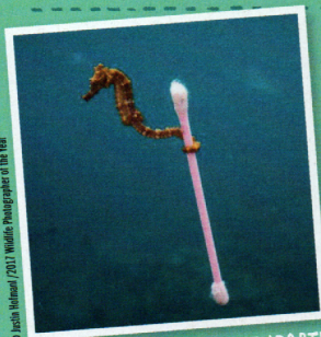
CETTE TRISTE PHOTO A REMPORTÉ UN GRAND PRIX DE PHOTOGRAPHIE ANIMALIÈRE EN 2017.

Vos plastiques, s'il vous plaît ! À l'entrée du pays, les sacs non biodégradables sont confisqués depuis 15 ans. À la place, des sacs en papier ou en coton, en partie payés par le gouvernement. La moitié des pays d'Afrique ont interdit le plastique.