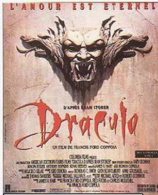
Affiche du film, Dracula de F. Coppola (USA 1992).