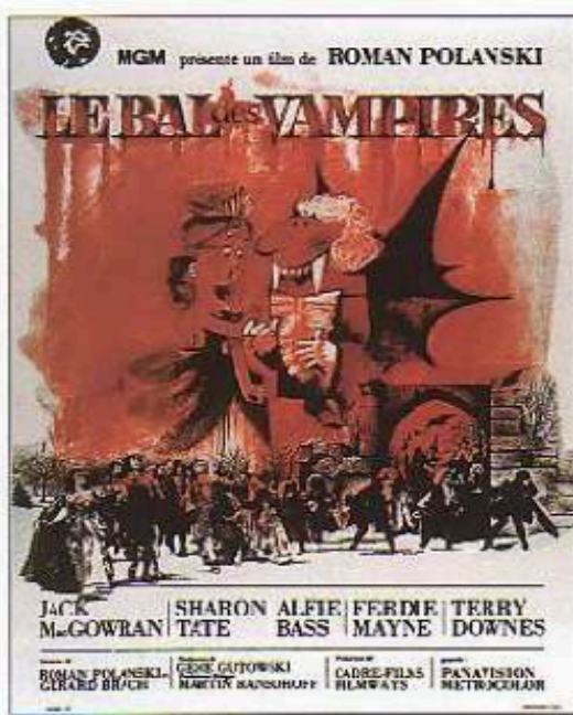
Affiche du film, Le bal des vampires, de R. Polanski (USA, 1968)