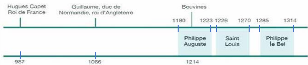
Document 1 : frise chronologique