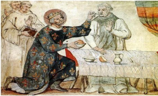
Louis IX donnant à manger à un malade

« Dès son enfance, le roi eut pitié des pauvres et des malheureux ; et il établit que partout où il allait, il y eut constamment ceint vingt pauvres nourris chaque jour en sa maison, de pain, de vin, de viande ou de poisson. [...] Avec cela, il avait chaque jour à diner et à souper, auprès de lui, des vieillards et des infirmes, et leur faisait servir la même nourriture qu'à lui-même. »