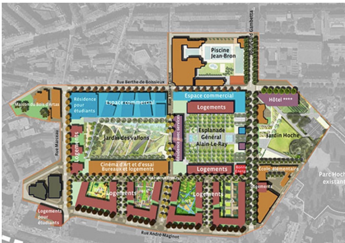
Doc 2 : L'éco-quartier de la caserne de Bonne à Grenoble

L'éco-quartier de la caserne de Bonne, c'est le premier éco-quartier à avoir vu le jour en France. Ce quartier construit sur le site d'une ancienne caserne militaire comprend :