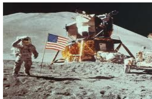
Premiers pas sur la Lune

Les satellites sont utilisés pour photographier et surveiller la Terre, établir des communications (télévision, téléphone ...), faire des observations météorologiques.