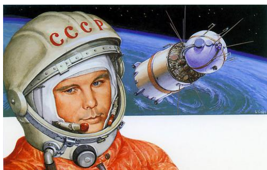
Youri Gagarine et sa capsule Vostok

Les Soviétiques, pour réaliser cet exploit, ont transformé un missile en lanceur spatial afin de propulser le spoutnik dans l'espace.