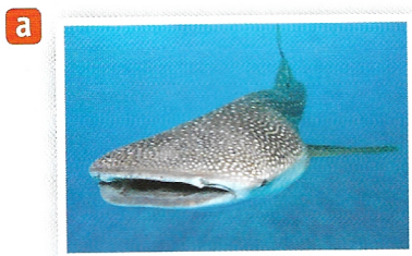
Longueur d'un requin-baleine