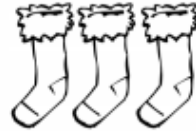
trois chaussettes bleues .