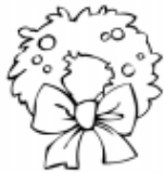
une petite couronne.