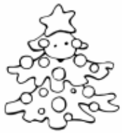
un grand sapin.

Il indique comment est la personne, l'animal, la chose ou le lieu.