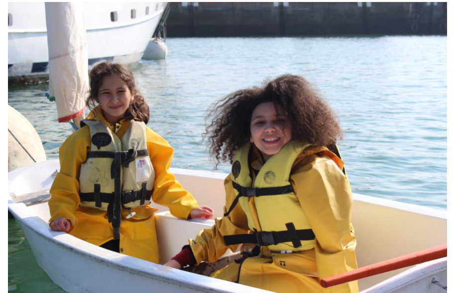
Tous les binômes sont fin prêts ! On peut y aller.