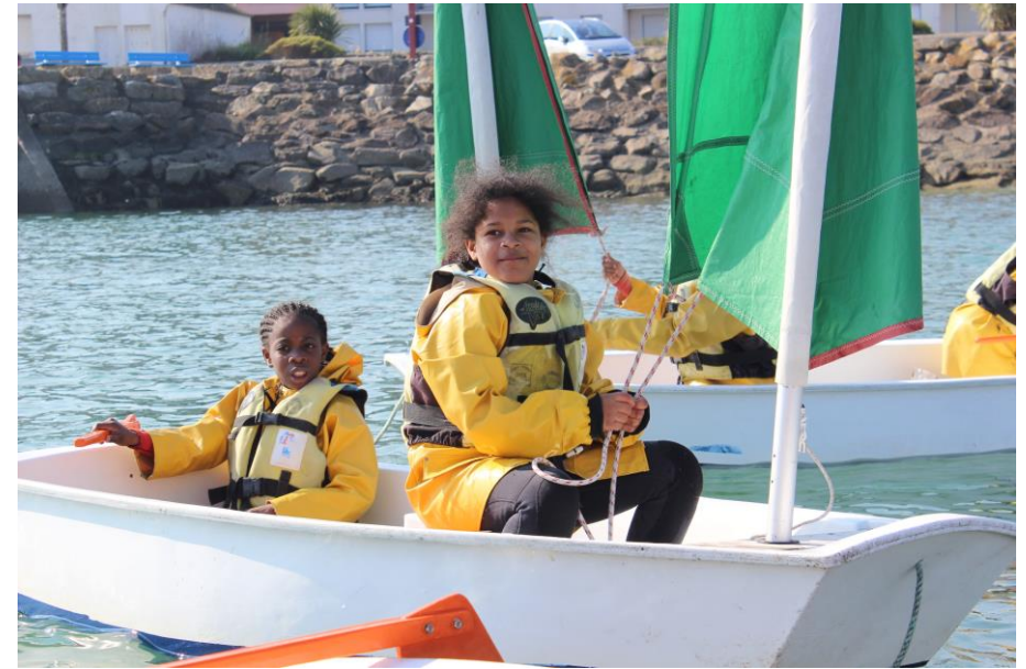
Les filles sont prêtes !