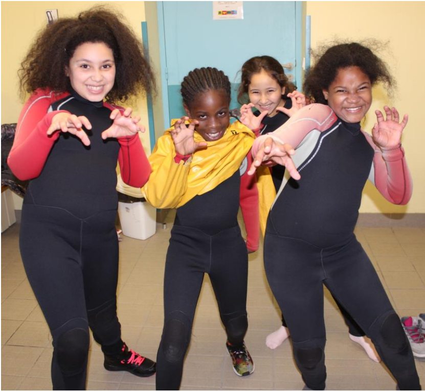
Ça rigole beaucoup dans le vestiaire de ces 4 poulettes...