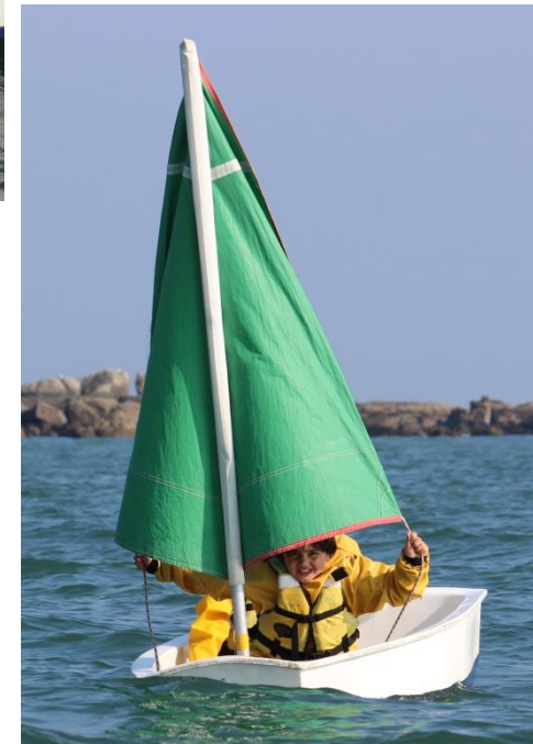
Derrière : l'île aux oiseaux