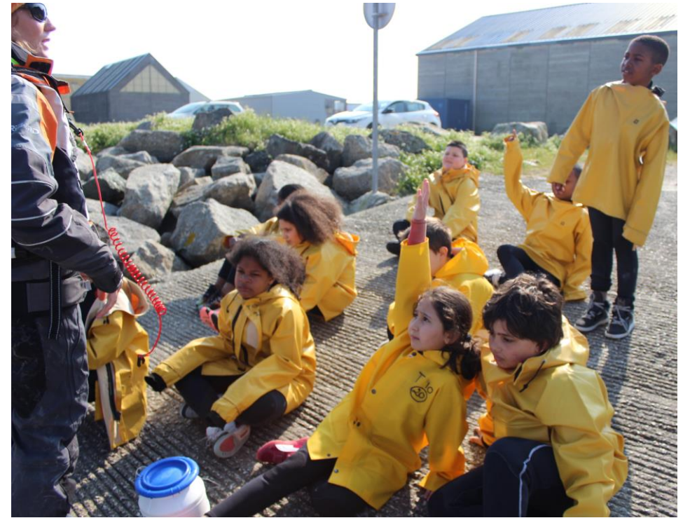
Avant de partir en mer... Le point sur... La météo