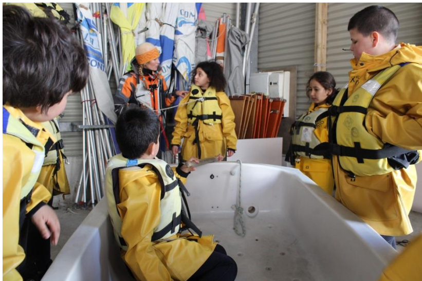
Comment s'accrocher et se décrocher avec l'optimist des copains !