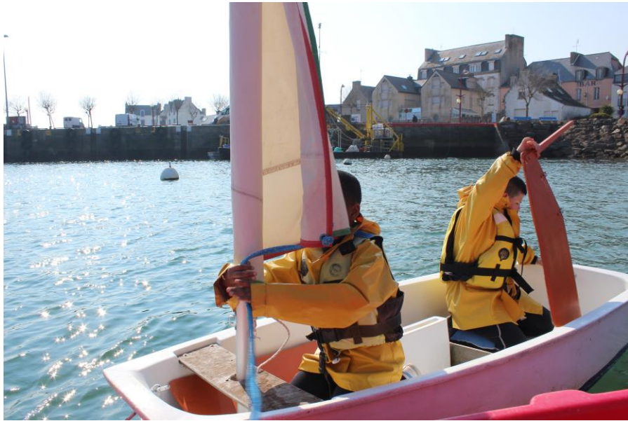
Les garçons placent le gouvernail.