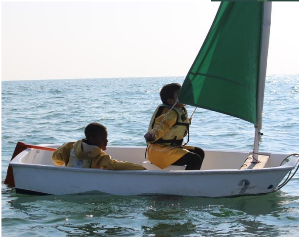
Chacun navigue par ses propres moyens !