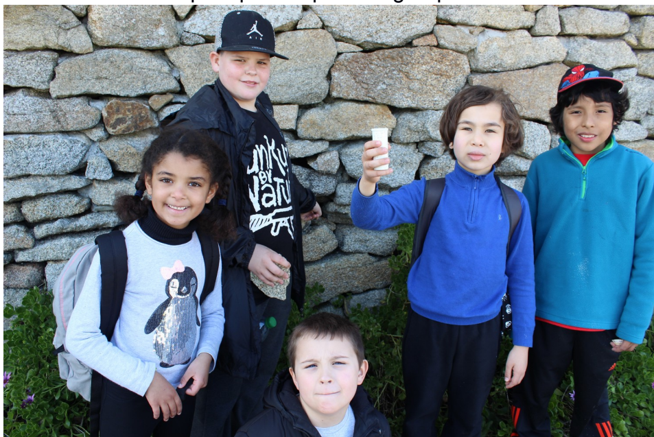
...Ils ont trouvé ! Première cache appelée plage de Lesconil