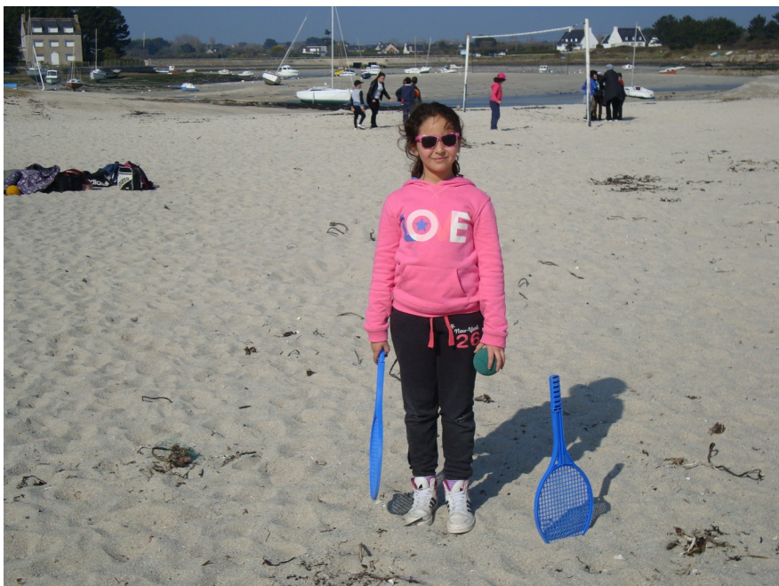
En mode raquette