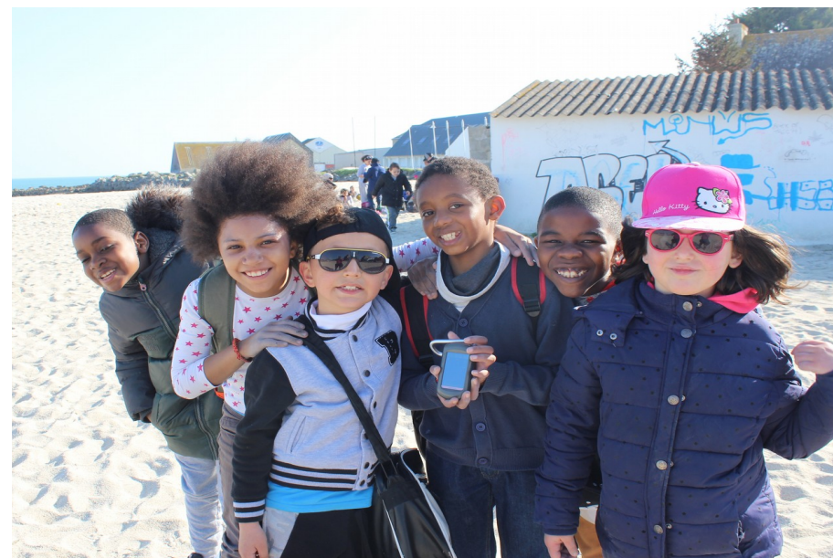
En route pour le deuxième groupe