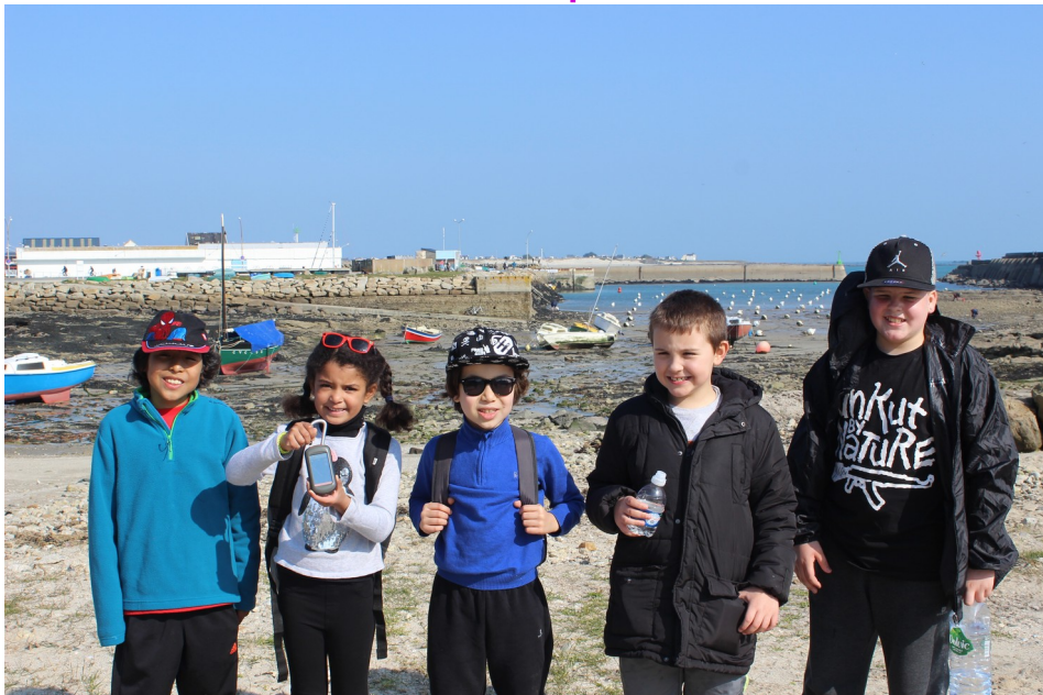
Et c'est parti pour le premier groupe !