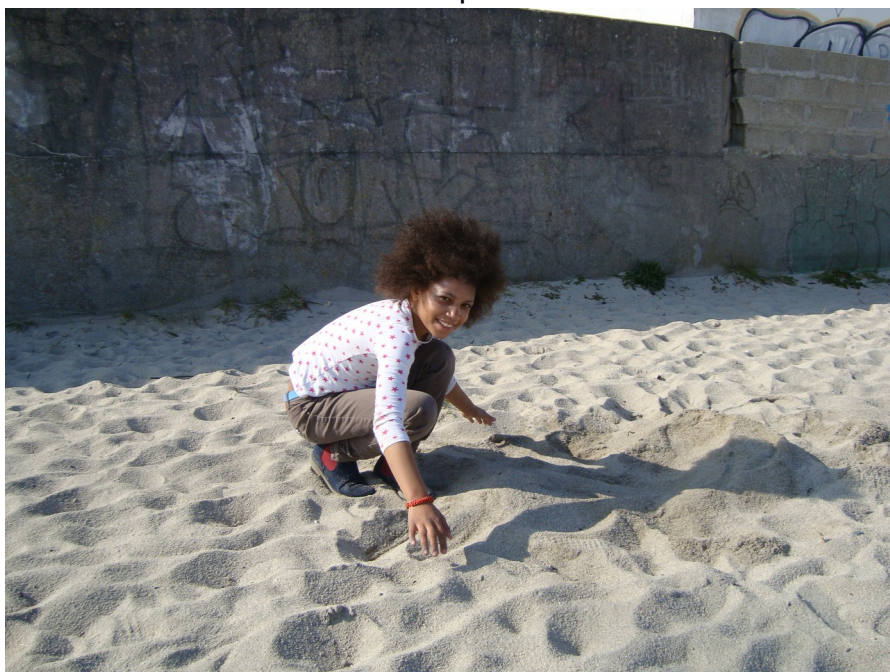
Ou encore sculpture sur sable