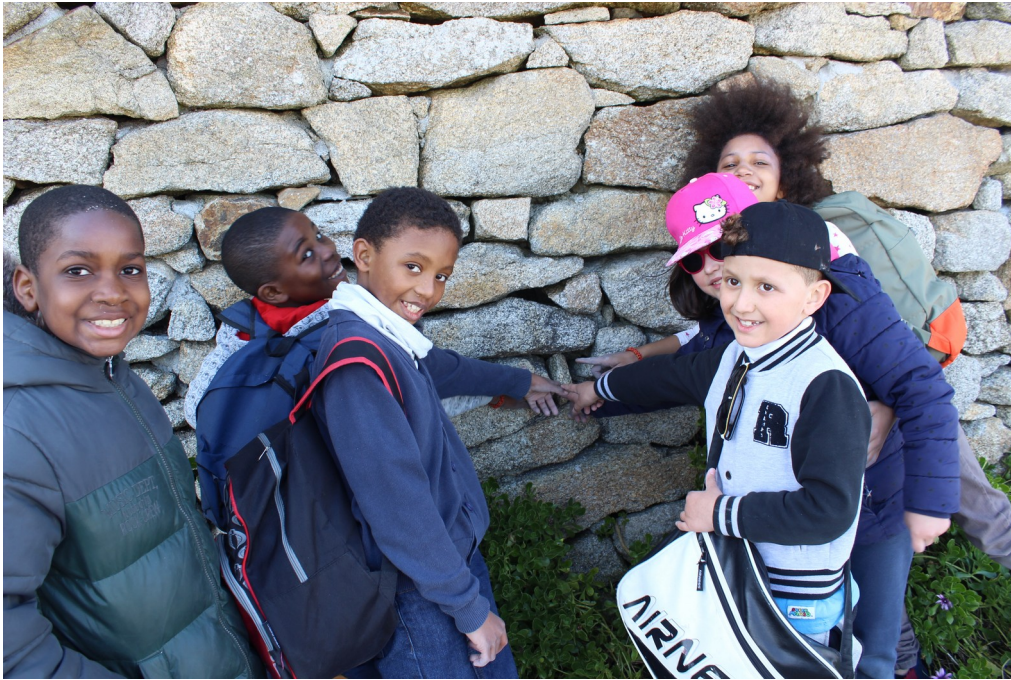
Elle est cachée ici...