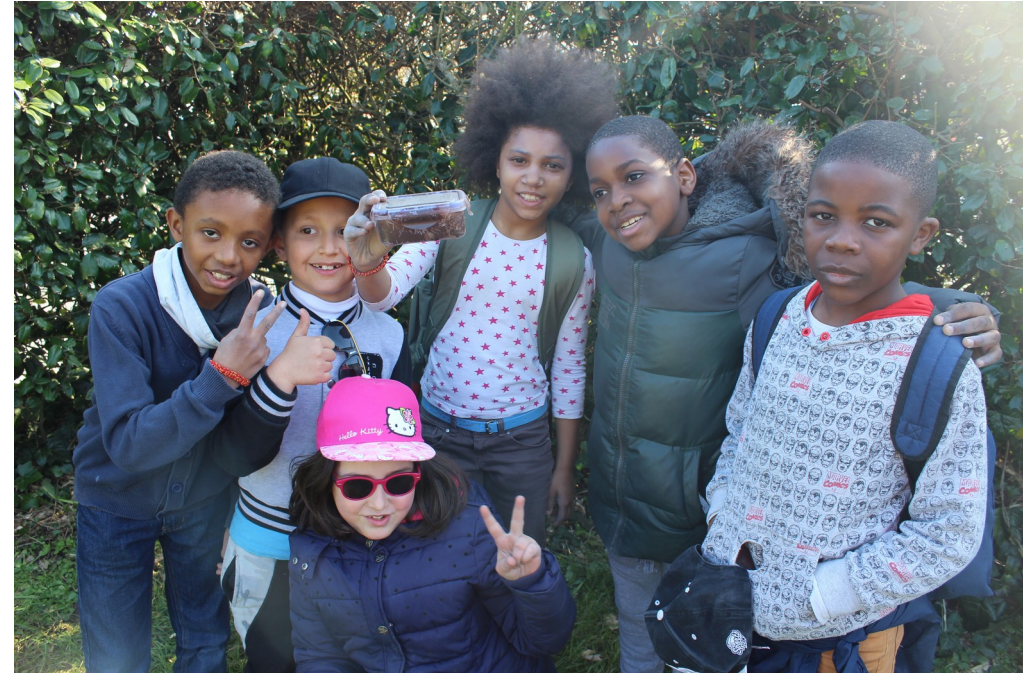
Et de deux !!! Bravo !