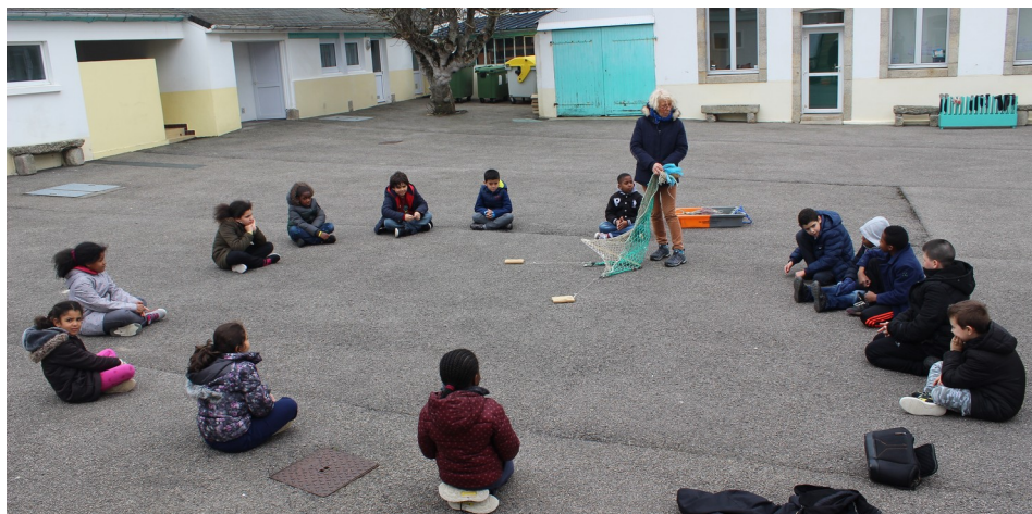
←---- Le chalut-----→