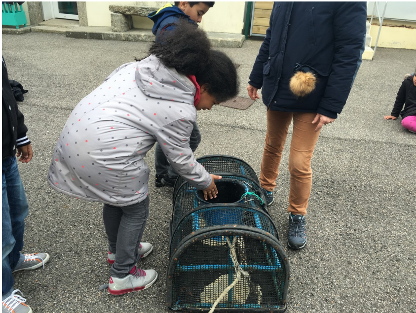
Le casier à crabes et araignées de mer

Après avoir étudié ces différentes techniques de pêche, en route pour le port, voir le débarquement de la pêche d'un chalutier... C'est très amusant. Les habitants sont nombreux pour venir voir ça et se bousculent même pour pouvoir se servir et choisir ce qu'ils veulent en premier ! De vrais enfants !