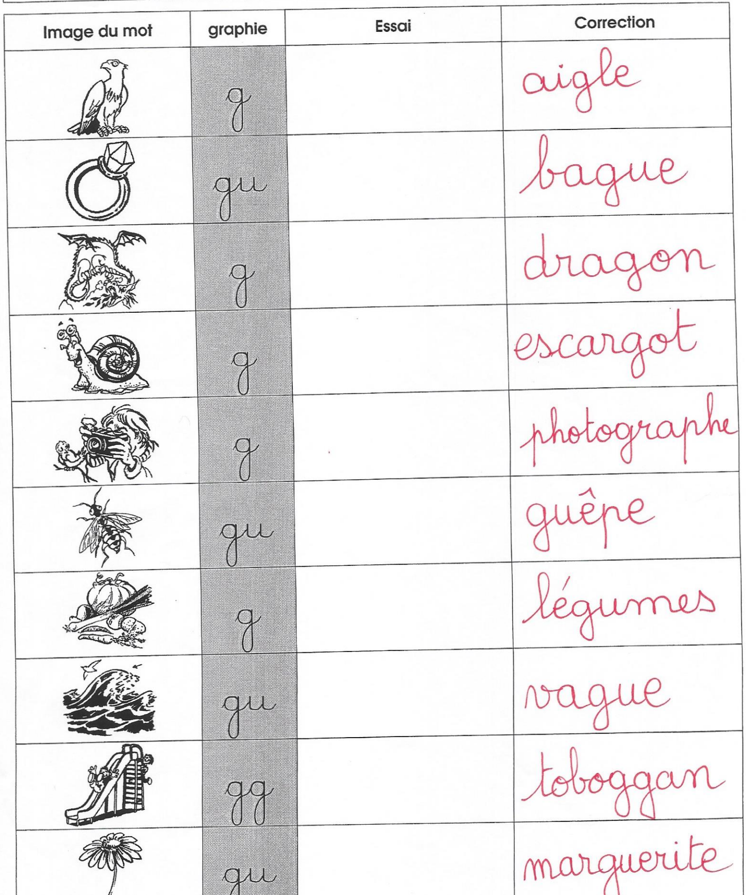
Tableau d'encodage : le son [ g ]