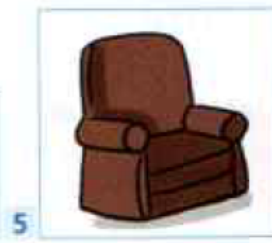
un grand fauteuil