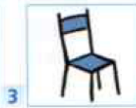
une chaise bleue