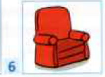
un fauteuil rouge