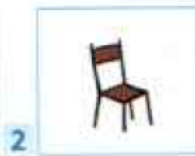
une petite chaise