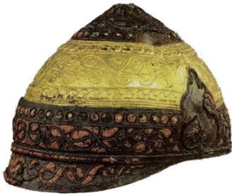
Casque gaulois en bronze, or, émail et fer, III e me s. av. J.-C.