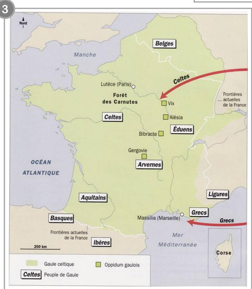
La Gaule celtique, VII ème -I er siècle av. J.-C.

Carte issue de Atlas d'Histoire cycle 3 , Magellan (Hatier)