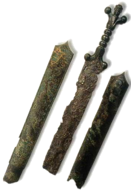
Epée courte et son fourreau