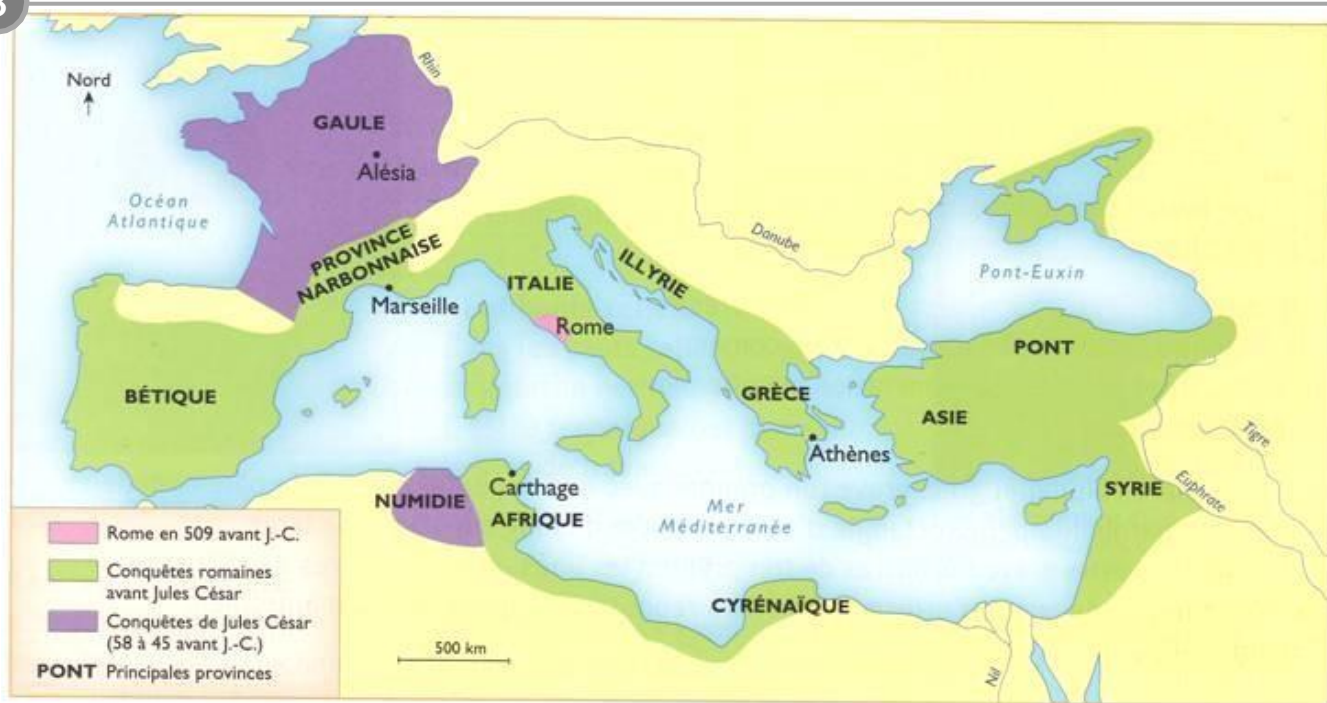
Les conquêtes romaines au temps de Jules César